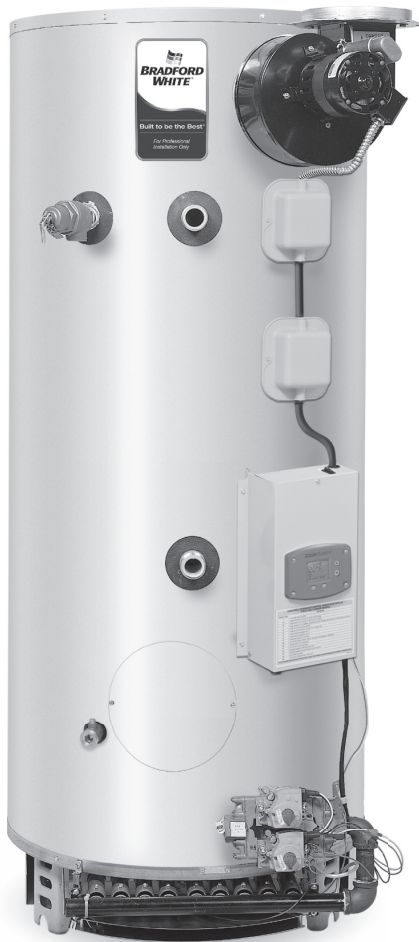
Photo du D-65T-625-3NA